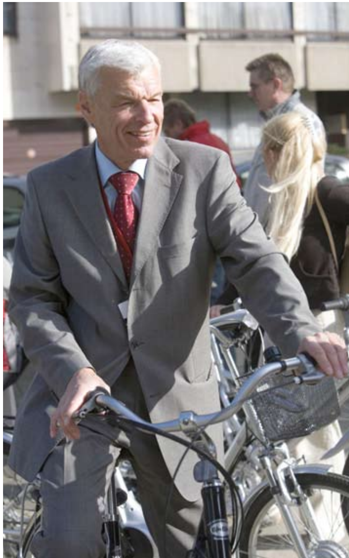
Briuselyje ir Strasbūre europarlamentaro susisiekimo priemone neretai tampa dviratis.

Antrąją savo kadenciją Europos Parlamente baigiantis Justas Vincas Paleckis aktyvioje politikoje sukasi jau daugiau nei 50 metų. Tačiau būtent pastarąjį dešimtmetį socialdemokratas vadina įdomiausiu savo karjere. Žurnalas „Europos Ritmu“ su europarlamentaru kalbėjosi apie tai, kas labiausiai per šiuos dešimt metų įsiminė, buvo netikėta ir įdomu.