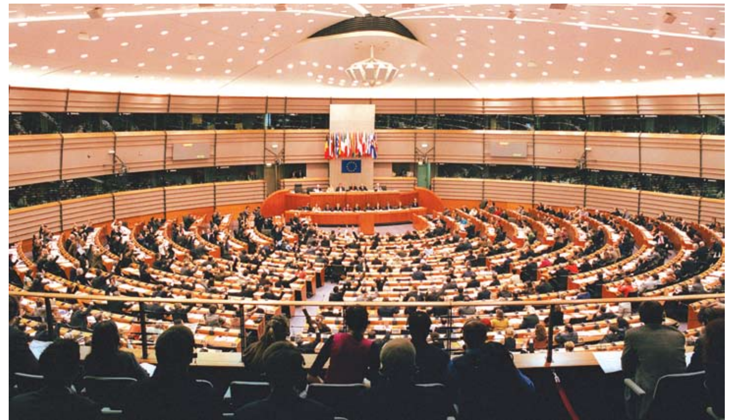
Europarlamentaras kategoriškai nesutinka su nuomone, kad „Briuselis kam nors ką nors nurodinėja“, nes absoliučiai visi Europos piliečių gyvenimus lemiantys sprendimai priimami bendru sutarimu.

tapo aišku, kad tokioje didelėje institucijoje kažką pasiekti galima tik ieškant ir randant sąjungininkų. Dirbti, ko gero, įdomiausia buvo komitetuose. Pavyzdžiui, užsienio reikalų komitete daug dirbau delegacijose santykiams su Rusija ir Baltarusija, stengdamasis, kad šie santykiai būtų kuo normalnesni, nors abi šios valstybės yra labai problematiškos tiek Lietuvai, tiek visai ES. Vis tik manau, jog itin svarbu, kad santykiai su jomis nenutrūktų. Ypač kalbant apie Baltarusiją, manau, kad jokia būdu negalima šios šalies izoliuoti, numoti į ją ranka ir tarti, kad ji Europos