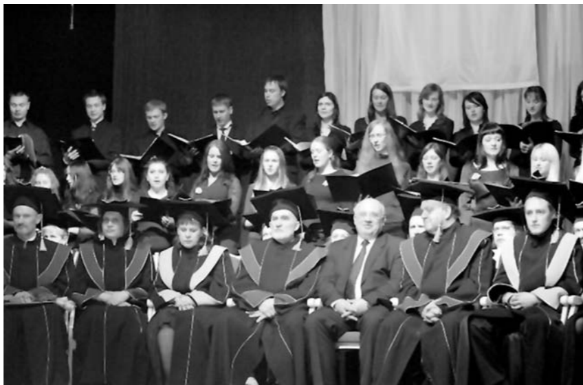
Šiaulių universiteto bendruomenės šventėje

Politikas pabrėžė, kad vis dėlto neapsiribos diskusijomis, o turi konkrečių darbų planą. „Planuojame sukurti municipalinio būsto