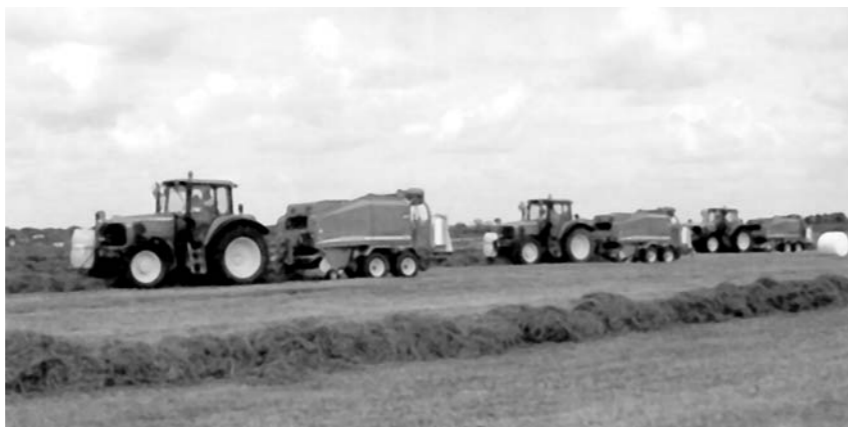
Žemės ūkio bendrovių laukus prižiūri moderni technika.

kuriems ES tiesioginių išmokų suma viršija 5 tūkst. eurų (17264 Lt), buvo nurodyta taikyti moduliaciją ir sumažinti išmokas pagal tam tikrą formulę. Tokiu būdu šalies gyvulininkystės ūkiai vien už pernai parduotą pieną ar užaugintus gyvulius negavo apie 44 mln. litų išmokų. Ypač nukentėjo bendrovės, užsiimančios gyvulininkyste. Yra bendrovių, kurioms nubraukta net po 200-300 tūkst. litų. Dėl tokių veiksmų nukentėjo ir didieji augalininkystės ūkiai, investavę į savo ūkių modernizavimą milijonus litų. Mūsų asociacija yra įsitikinusi, kad žemdirbių interesai turi būti apginti.