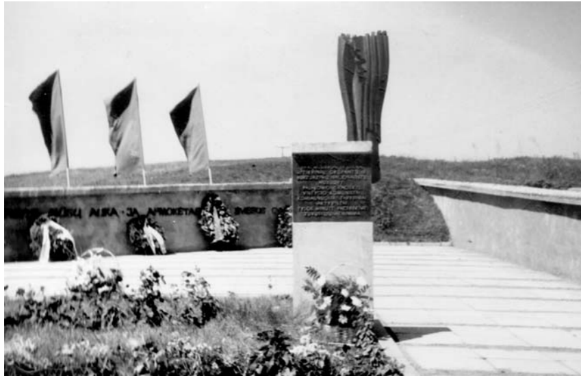
Sušaudytiems žmonėms Vištytyje ant Ilgojo kalno atminti buvo pastatytas R. Antinio paminklas (nuotr. viršuje). Netrukus po nepriklausomybės atgavimo jis „dingo“, vėliau buvo nuplėšta ir metalinė lentelė su paaiškinimu kas čia sušaudyta (nuotr. apačioje).