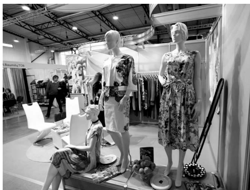
Vilniaus tekstilės parodoje buvo daug įdomių naujovių.