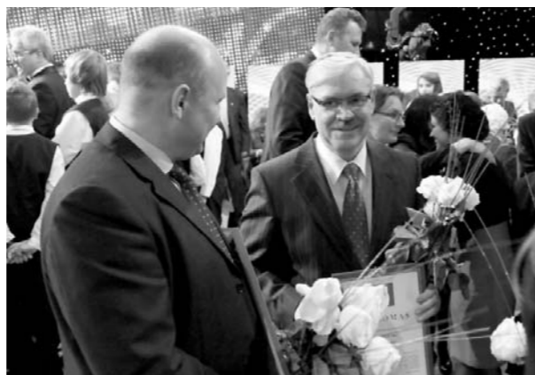
„Gairės“ nuoširdžiai sveikina Europos Parlamento narių, LSDP pirmininko pavaduotoją Zigmantą Balčytį, užkopusių į šešiasdešimtmečio viršukalnę. Linkime, kad gyvenimo skaičiai skambėtų kaip simfonijos garsai, o Jūsų darbai paliktų kuo daugiau sėkmės Lietuvai pėdsakų.

Šie skaičiai rodo, kad išmokos didės pakankamai lėtai. Spartesnis išmokų didėjimas – taip pat derybų kelias, kuriuo turi būti žengiami vieną visoms trims Baltijos valstybėms – Lietuvai, Latvijai, Estijai. ■