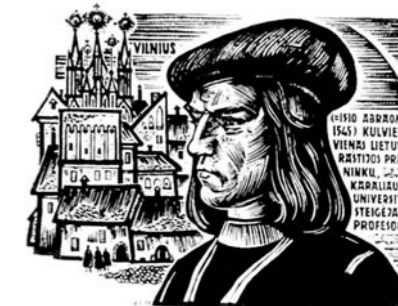
A. R. Šakalio pieš.

kitų religinių konfesijų atstovams, kai matyti, kad Lietuvoje yra valstybinė religija. Eilinį kartą paminama LR konstitucija. Skaudu.