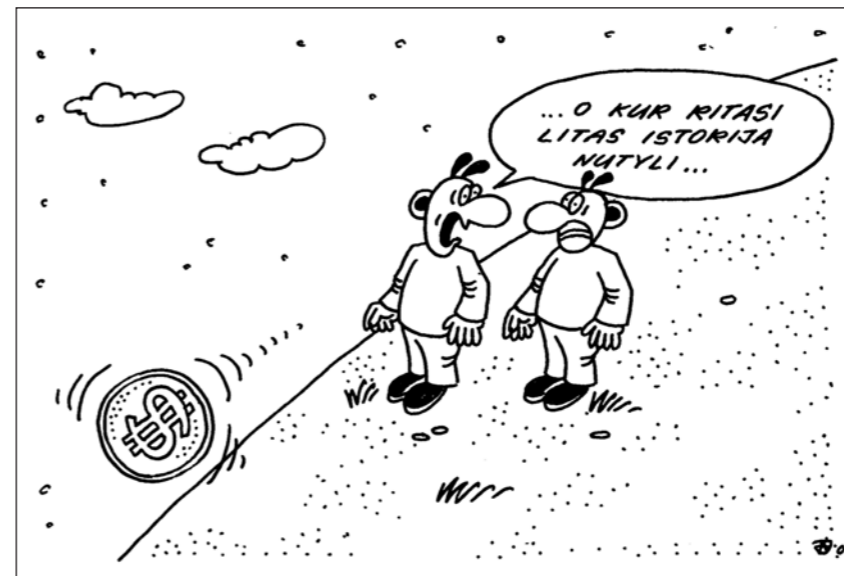
A. Janušonio pieš.

Verslininkai, darbdaviai ir jiems tarnaujantys įvairaus plauko ekspertai, besipriešinantys minimalios algos didinimui, nuolat kartoja tą patį melą, to savo melo nesugebėdami pagrįsti jokiais argumentais, skaičiais ar faktais. Jie sako, kad didinti minimalaus atlyginimo negalima todėl, kad darbuotojai nesukuria pakankamai pridėtinės vertės, kad jų mažas darbo našu-