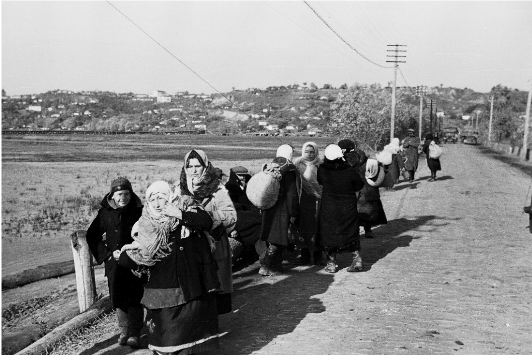
Žydai, nešini daiktais, eina į nurodytą susirinkimo vietą. Lubnai, Ukraina, 1941 metai