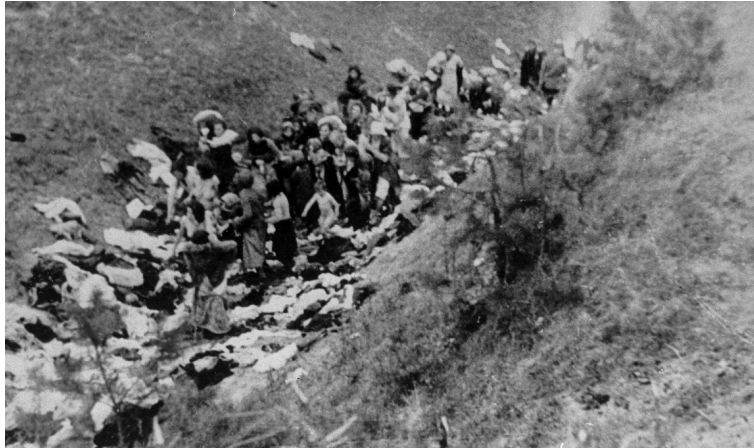
Mizočo žydės ir vaikai nusirengia prieš sušaudymą. Ukraina, 1942 metai