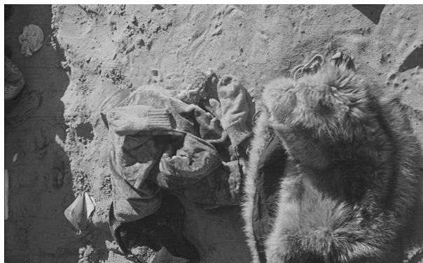
Žydy, nužudytų Babij Jaro dauboje, daiktai. Kijevas, Ukraina, 1941 metai