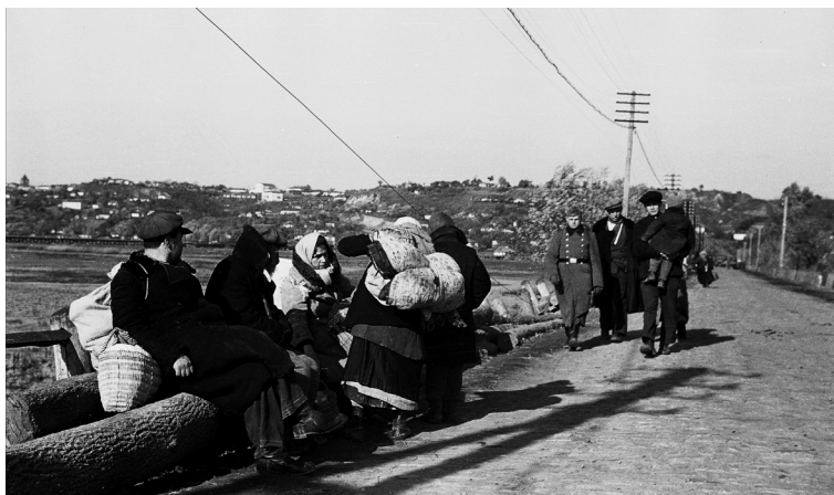
Žydai su daiktais eina į nurodytą surinkimo vietą. Lubnai, Ukraina, 1941 metai

Torunė, Užkarpatės sritis, Ukraina. 2012 metų gegužės 18 diena