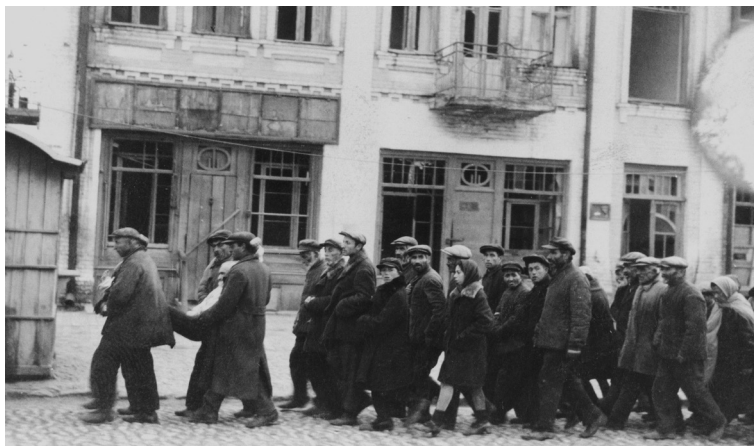
Žydų tremtiniai eina Podolės Kameneco gatvėmis į sušaudymo vietą už miesto. Ukraina, 1941 metai

Kelias, kuriuo žydai buvo vedami į sušaudymo vietą. Fintina Alba, Moldavija.