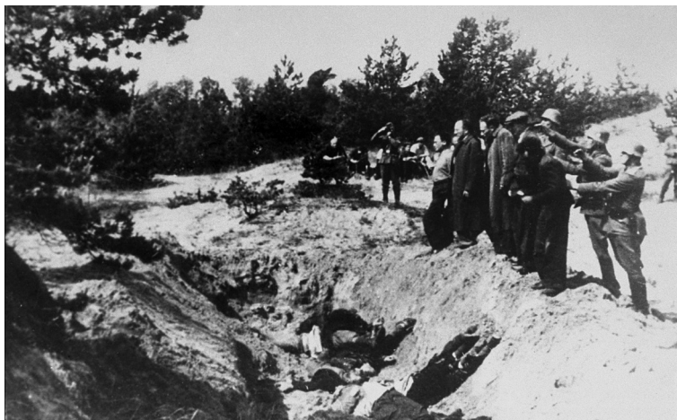
Waffen-SS ir SD karininkai rengiasi žydų egzekucijai. Rusija, 1942 metai

Ladožskaja, Krasnodaro kraštas, Rusija. 2012 metų kovo 31 diena