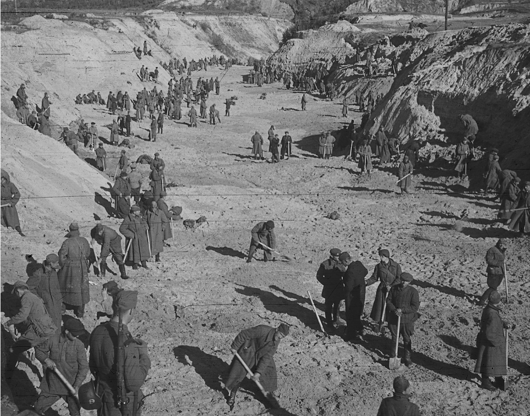
Sovietų karo belaisviai ir vokiečių kareiviai užkasa masinius kapus Babij Jaro dauboje. Kijevas, Ukraina, 1941 metai