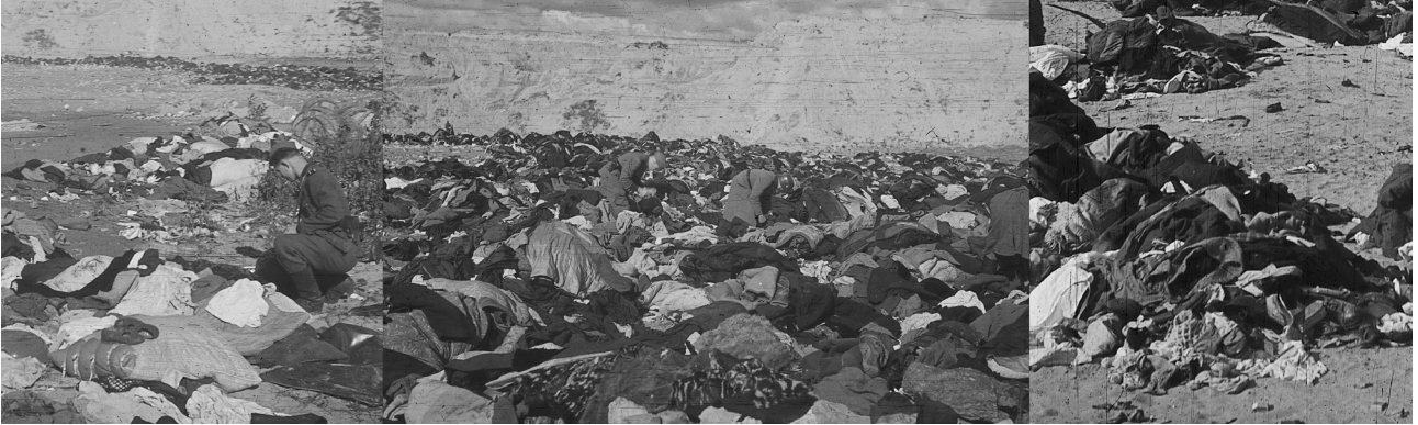
Vokiečių policininkai tikrina Babij Jaro dauboje nužudytų žydų daiktus. Kijevas, Ukraina, 1941 metai