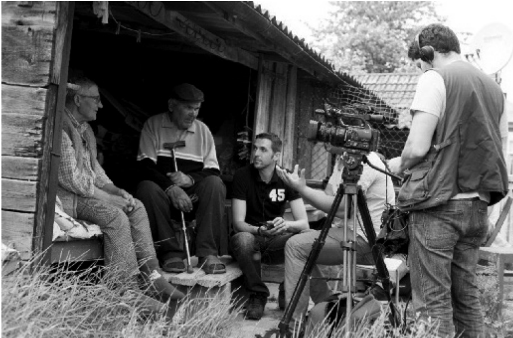
Sofrinkanai, Belcio rajonas, Moldavija, 2013 metų gegužė.

Hrymailivas, Ternopilio sritis, Ukraina, 2009 metų gegužė.