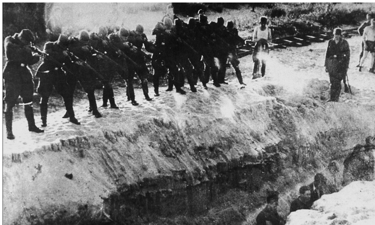
Einsatzkommando šaudytojų būrys sušaudo griovyje stovinčių vyrų grupę. SSRS, 1941–1942 metai

Masinė kapavietė, kur buvo nužudyta maždaug 3 tūkstančiai aukų. Naumovičiai, Gardino sritis, Baltarusija