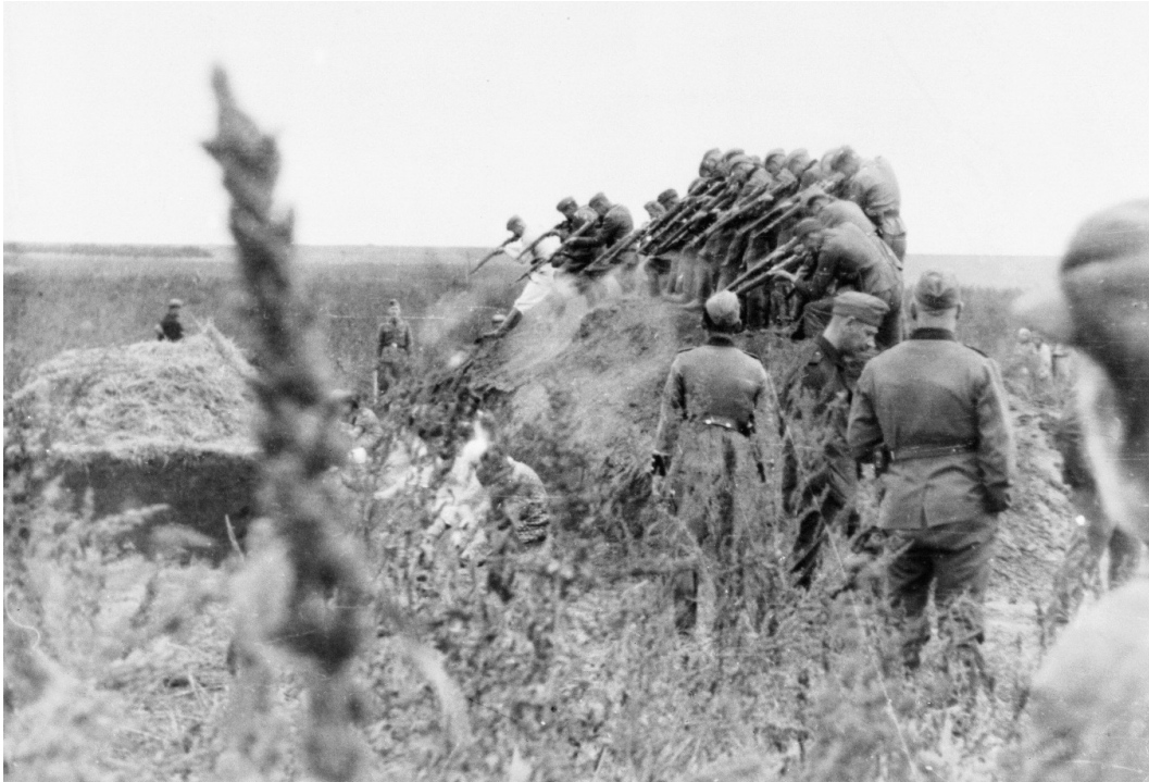
Einsatzkommando šaudo žydus lauke Dubesaryje. Moldavija, 1941 metai