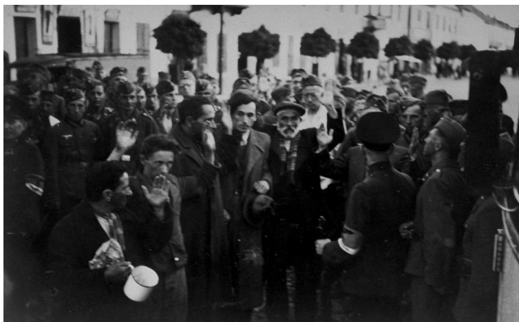
Vokiečių kareiviai apsupo grupę žydų Balstogėje. Lenkija, 1940–1942 metai

Izlučistė, Dniepropetrovsko sritis, Ukraina. 2010 metų gegužės 26 diena