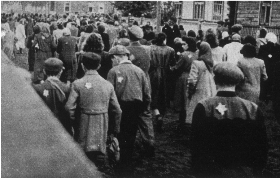
Ukrainos žydai pakeliui į registracijos punktą, vokiečiams ir rumunams okupavus Odesą. Ukraina, 1941 metai