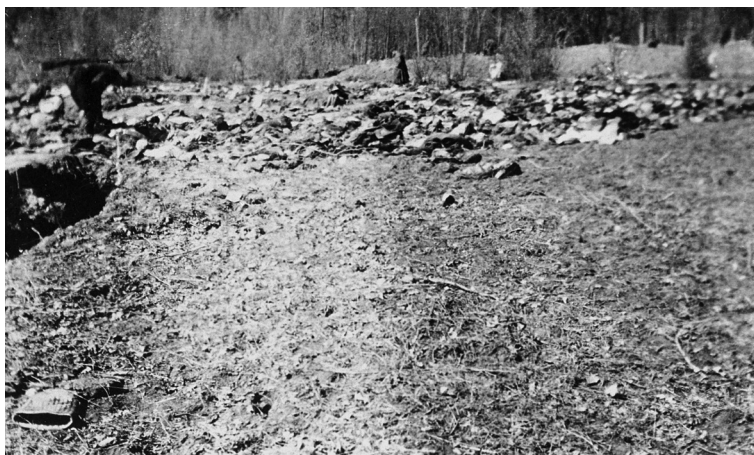
Nežinomi vyrai rausiasi lauke, kuriame primėtyta tūkstančių Vynicioje nužudytų žydų drabužių. Ukraina, 1941 metai

Rabino namas. Tytuvėnai, Šiaulių apskritis, Lietuva. 2013 metų lapkričio 23 diena