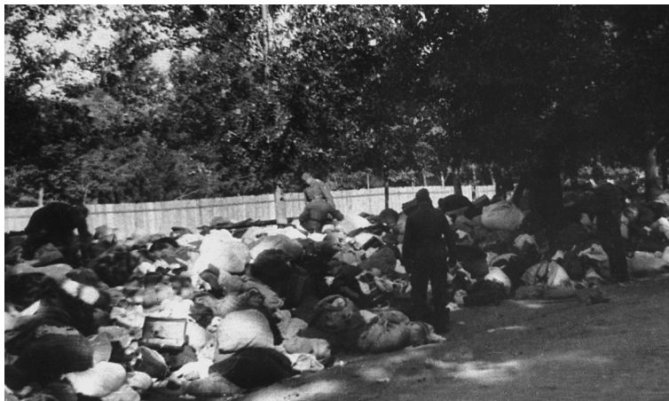
Nenustatyto dalinio vokiečiai rausiasi žydų, nužudytų Babij Jaro dauboje, daiktuose. Kijevas, Ukraina, 1941 metai

Mstislavlis, Mogiliavo sritis, Baltarusija. 2012 metų gegužės 1 diena