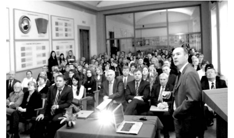
Mokslininkai žvelgia į naujus tolius

Pagal inovatyvumo koeficientą Europoje iš 27 valstybių užimame tikrai nelabai garbingą 26 vietą, aplenkę tikrai Latviją. Blogiausia tai, kad visos 27 ES valstybės per pastaruosius penkerius metus savo inovatyvumo rodiklį nuolat didina, nepriklausomai nuo sunkumų. Vienintelė Lietuva savo inovatyvumo rodiklį mažina, per tą laikotarpį jis sumažėjo beveik 1 procentu. Tai rodo, kad mūsų visuomenėje įvairūs išsilavinimo, pasitikėjimo mokslu rodikliai yra prastesni nei priimtina.