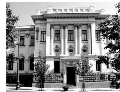
Mokslų akademija, įgyvendindama savo misiją, siekia šių svarbiausių tikslų:

– Šalyje yra 60 savivaldybių, bendradarbiavimo sutartis esame pasirašę tik su septyniomis iš jų, bet ir taip susidaro nemenkas krūvis. Per metus savivaldybėse susikaupia nemažai klausimų, į kuriuos žmonės tikisi gauti atsakymus iš kompetentingų asmenų. Tokios klausimų – atsakymų dienos vietose susilaukia didelio klausytojų dėmesio.