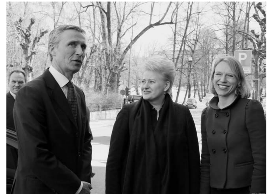
Osle susitiko Norvegijos premjeras J. Stoltenbergas ir Lietuvos Prezidentė D. Grybauskaitė.

Dar prieš 100 metų Norvegija buvo viena iš skurdžiausių Europos šalių. 1970 m. Šiaurės jūroje buvo rasta gamtinių dujų ir naftos, tai lėmė žymų šalies ekonomikos pakilimą ir stabilumą. Norvegija yra klestinčios gerovės šalis, kurioje suderinta laisvoji rinka ir vyriausybės kontrolė. Šalyje kontroliuojamos tik tam tikros sritys, pavyzdžiui, naftos sektorius. Norvegija nėra ES narė, tačiau nuolat prisideda prie jos biudžeto. Norvegų pragyvenimo lygis ir gaunamos pajamos yra vienos aukščiausių pasaulyje.