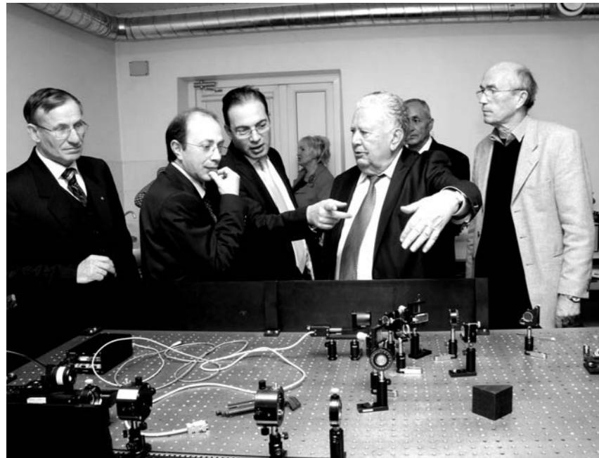
Armėnijos mokslų akademijos delegacija apsilankė Fizinių ir technologijos mokslų centre.

Lietuvos mokslų akademijos prezidentai buvo: V. Krėvė (1941), J. Matulis (1946-1984), J. Požela (1984-1992), B. Juodka (1992-2003), Z. R. Rudzikas (2003-2009).