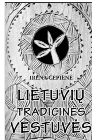
IRENA ČEPIENĖ Lietuvių tradicinės vestuvės

Knygoje išsamiai aprašomi įvairių Lietuvos etnografinių regionų vestuviniai papročiai ir apeigos, nuo piršlybų iki sugrąžtų. Plačiausiai nagrinėjamos XIX a. pabaigos-XX a. pradžios vestuvių apeigos. Pateikiama tradicinių vestuvių veikėjai, jų funkcijos. Kiekvienas besiruošiantis tuoktis šioje knygelėje ras ir pritaikys sau priimtinius tradicinių vestuvių elementus – papročius ar apeigas, nulemiančias būsimos šeimos gerovę, prasmingai pajvairinančias šiuolaikinių vestuvių scenarijų.