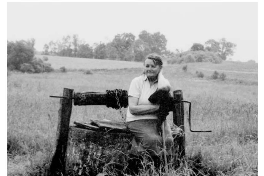
Buvo kaimas ir kaimo nėra...

Sutinku, kad smulki nuosavybė, smulkūs ūkeliai kol kas negali duoti didelės ir vertingos produkcijos (ateityje gali, nes galima išvystyti turizmą) – kad dabar ekonomiškai tai gali turėti tik nedidelę reikšmę. Ta ūkio sfera, kaip vykusiai pastebėjo Vytenis Andriukaitis, turėtų būti vadinama socialiniais ūkiais. Reikia neužmiršti ir puikaus Izraelio pavyzdžio, kur kibucai pavertė šalį žydiniu sodu. Ar negalėtų ir mūsų smulkūs ūkiai susikoooperuoti, žinoma, ne per prievartą, įkurti savo kooperacinę perdūrimo ir prekybos sistemą, kuri leistų jiems parduoti savo ypač ►