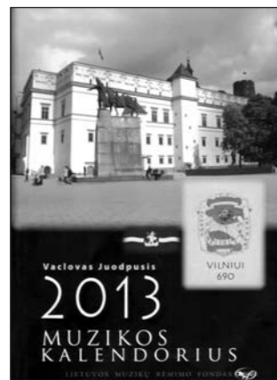
Anekdotas iš kalendoriaus