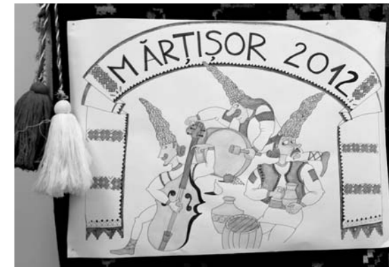
Sveikas, Marcišore!

– Jau šiek tiek atsakiau į šį klausimą, kai pasakojau apie mišrias šeimas. Žinoma, mes švenčiame religines, mūsų istorinės tėvynės valstybines šventes. Tačiau apie vieną šventę norėčiau papasakoti plačiau. Kovo 1 d. Rumunijoje ir Moldovos Respublikoje švenčiama pavasario atėjimo šventė – Marcišoras. Pavadinimas yra lotynų kilmės, nuo žodžio „Martie“. Tai tradicinė pavasario šventė, susijusi su žemdirbystės ciklu, o šventės ištakos siekia daugiau nei aštuonis tūkstančius metų. Šventės simbo-