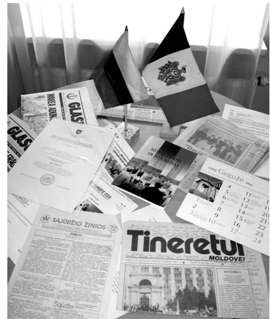
Atgimimo laikų spauda lietuvių ir moldavų kalbomis.

Šiuo metu bendrija jungia moldavus, gyvenančius Kaune, Vilniuje, Klaipėdoje, kitur. Nors bendrija yra negausi (60 žmonių), tačiau pats jos įkūrimo faktas yra nepaprastai svarbus tuo, kad žmonės būdami kartu gali išsaugoti savo kalbą ir tradicijas.