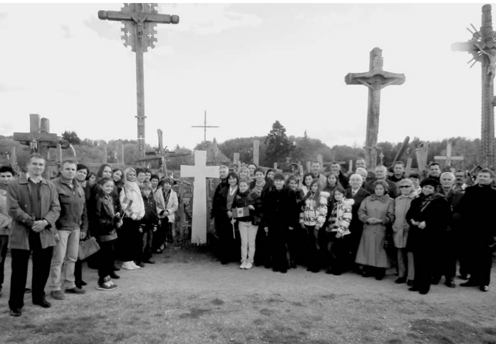
Lietuvos rumunų kultūros bendrijos „Dačija“ nariai Kryžių kalne prie savo pastatyto kryžiaus

Manau, kad moldaviškas kryžius Kryžių kalne – tai kultūrinis, moralinis, istorinis įvykis. Jis mus suvienijo, paskatino daugiau bendrauti, mes išgyvenome tuos pačius jausmus. Šiame balto akmens kryžiuje iš Moldovos yra kiekvieno mūsų dvasios dalelė. Ten prie Kryžių kalno mes nutarėme pradėti tradiciją – kiekvienais metais susitikti prie mūsų kryžiaus. ■