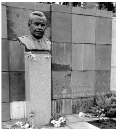
A. Sniečkauskas paminklas Vilniaus Antakalnio kapinėse dabar likęs nuniokotas vandaly.

Esu skaitęs, kad Maskvos emisaras Suslovas skundėsi, jog jam Sniečkus trukdo surusinti Lietuvą. Matyt taip ir buvo, kaip matome iš to dėdės pasakojimo.