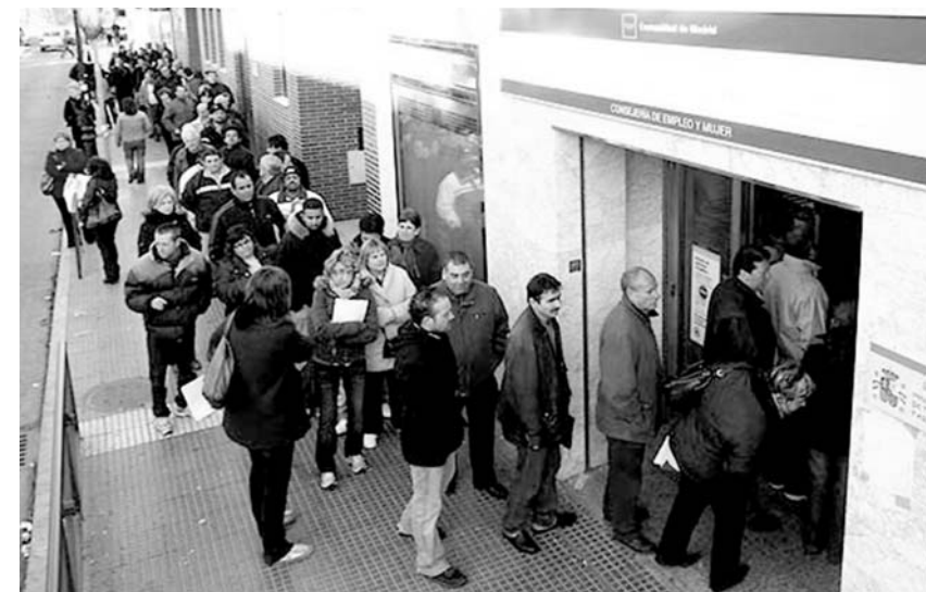
Vis gausesnė tampa socialinės paramos prašytojų armija.

Pasidomėjus, kaip kinta prašančiųjų skaičius, valdininkė atsakė, kad socialinės paramos prašytojų skaičiaus kitimas susijęs su galimybe nebelaukti Darbo biržoje tam tikro laikotarpio, kad būtų ga-