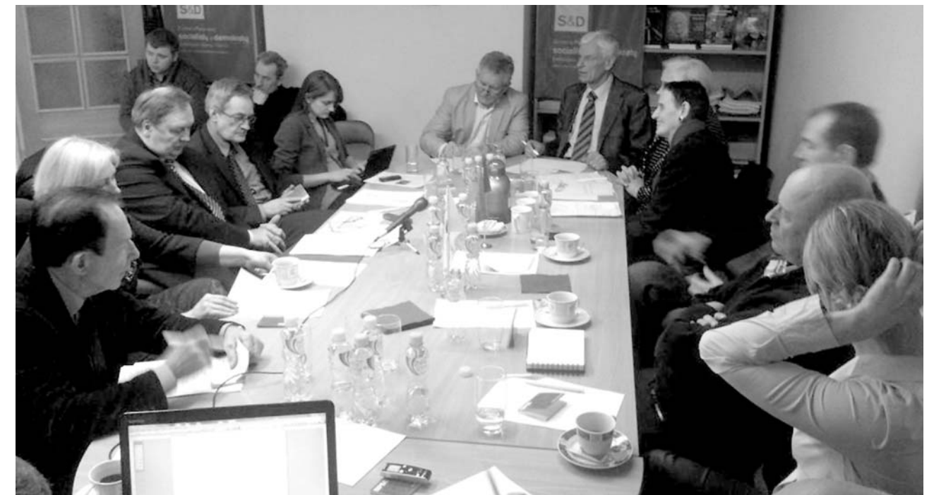
Apvalaus stalo diskusijoje apie emigraciją pareiškė daug įdomių minčių.

Neseniai Europos Komisijos už užimtumą ir socialinius reikalus atsakingas komisaras Laslo Andor pirmą kartą pritarė, jog laisvas žmonių judėjimas gali turėti ir neigiamų pasekmių. Kad šalys, investa- ►