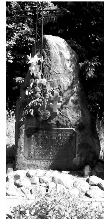
Pokario kovas primena ir paminklai.

Daug nekaltai žuvo žmonių. Buvo žudomi ir maži vaikai, ir seneliai. Tiksliai aukų skaičiaus niekas negali pasakyti. Tik tų dienų skausmas iki šiol beldžiasi į širdį. ■