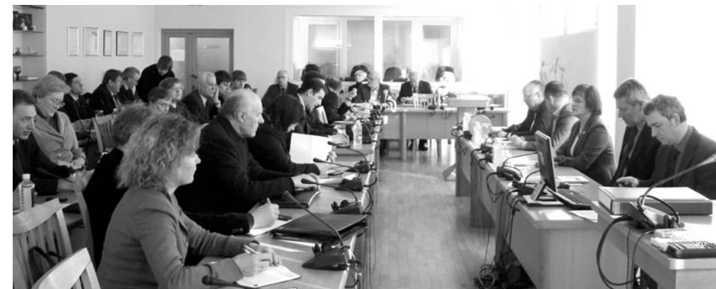
Lietuvos socialdemokratai surengė ekspertų ir politikų konferenciją apie renovaciją.